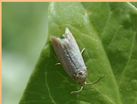
Adulto en reposo