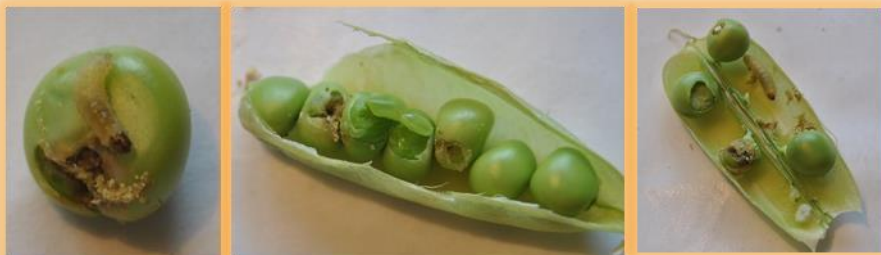
Daños en granos ocasionados por larvas