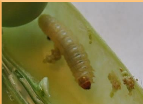
Larva y deyecciones en vaina de guisante