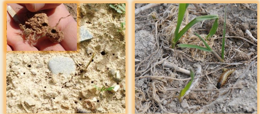
Galerías de entrada y salida