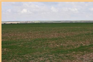
Parcela de cereal afectada