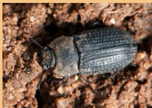
Adulto de Gonocephalum sp