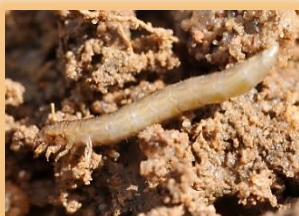
Larvas de Gonocephalum sp