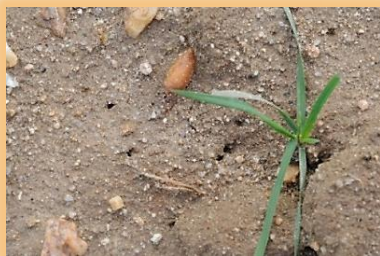
Orificios de entrada y salida