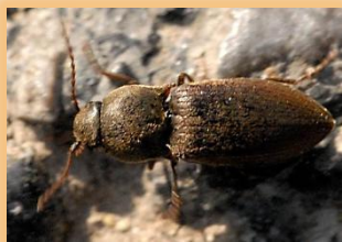
Adulto de Agriotes sp