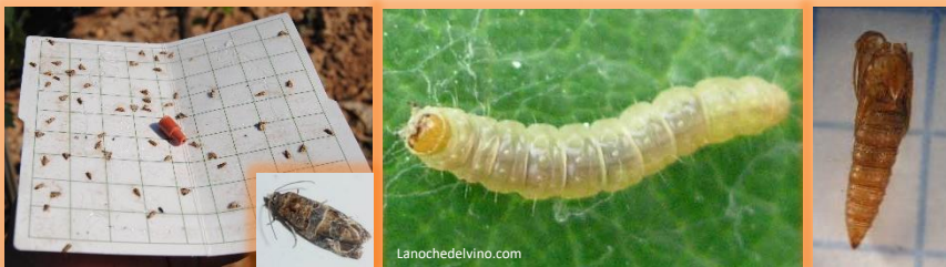
Adultos en trampa con feromona