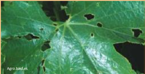
Mordeduras en hojas