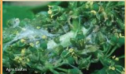
Daños por larvas en racimo