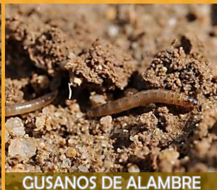
GUSANOS DE ALAMBRE