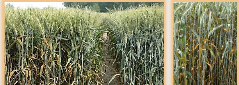
Parcelas con roya parda