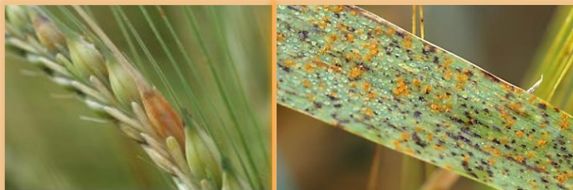
Pústulas en espiga