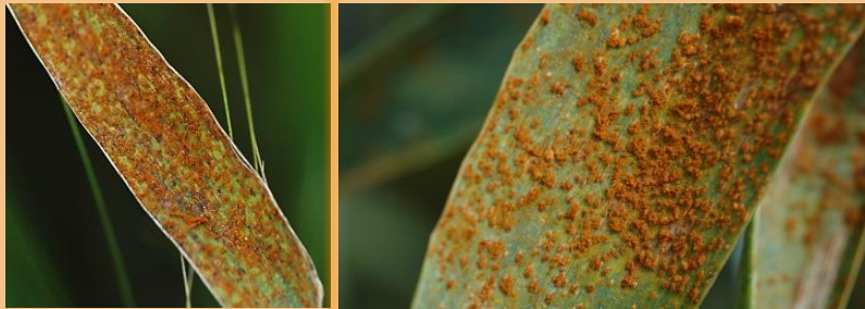
Pústulas en hoja