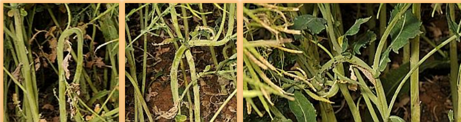
Deformaciones en tallo