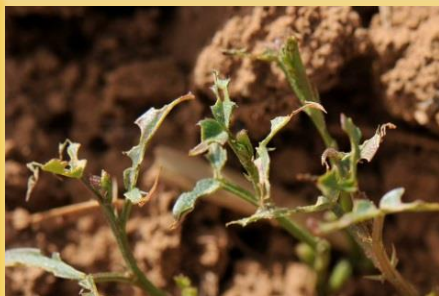
Muestras características en guisante y veza