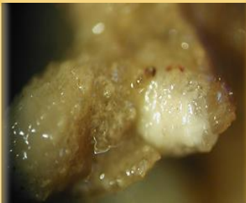
Larva atacando un nódulo