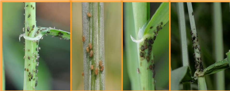
Plantas con colonias de pulgón