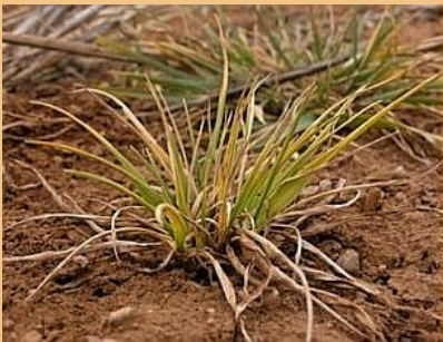
Expresión de BYDV