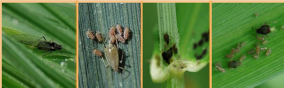
Adultos y ninfas