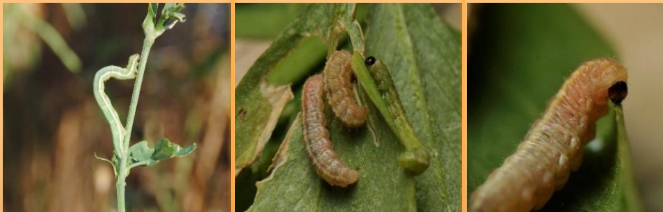
Larva de plusia