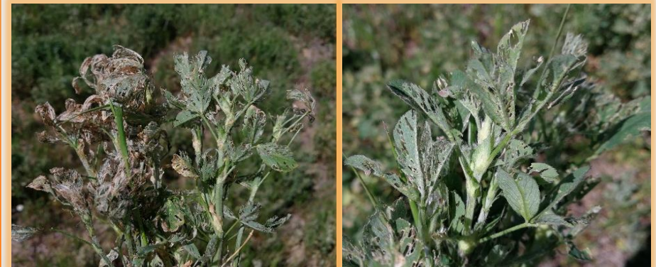
Síntomas de defoliación por las larvas