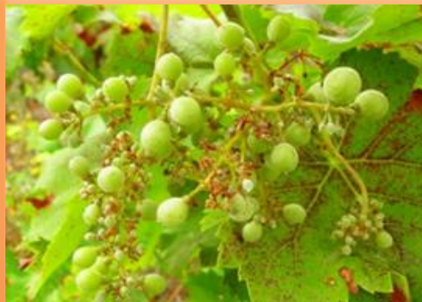
Ataque en racimo