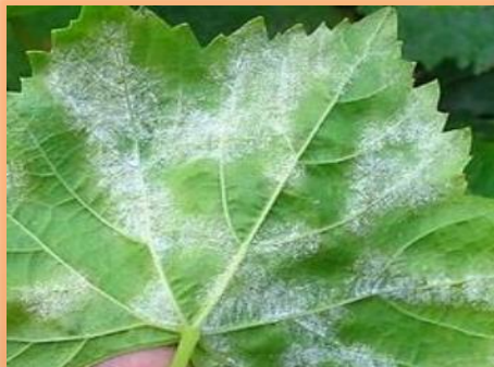
Polvo blanco en hoja