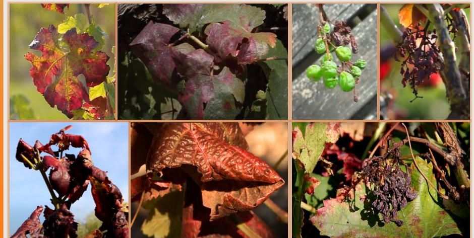
Síntomas en hojas (variedad tinta)