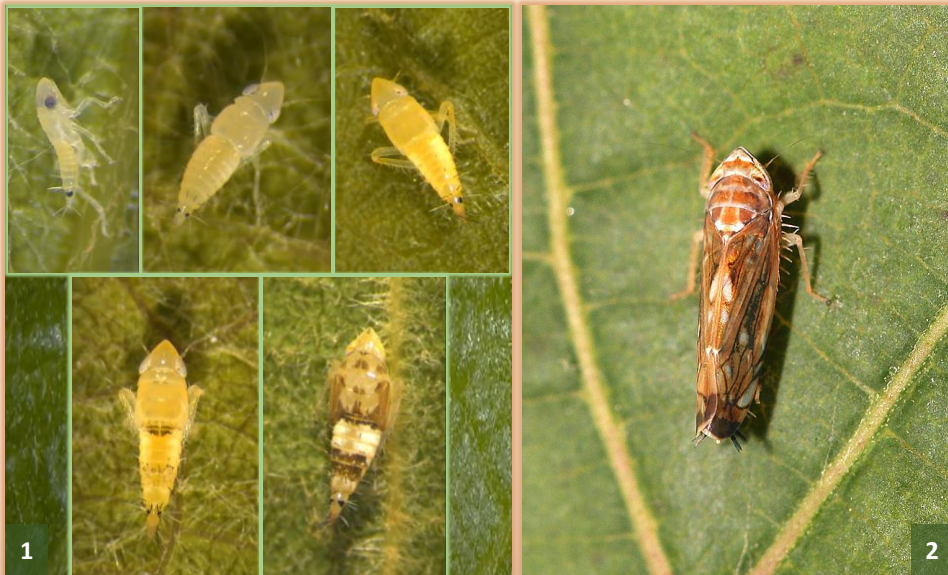
Estadios ninfales de S. titanus