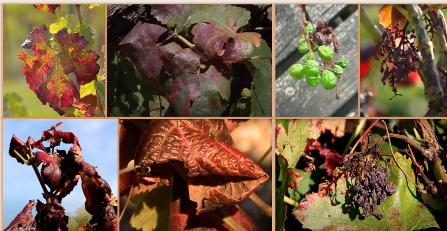
Síntomas en hojas (variedad tinta)