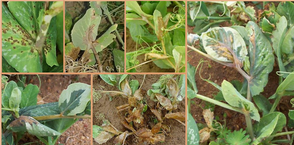
Sintomatología en hojas y tallos