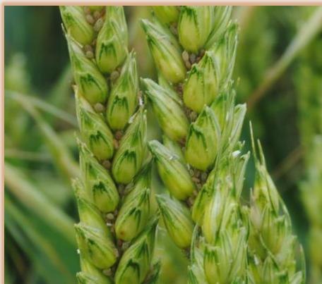
Pulgones en espiga