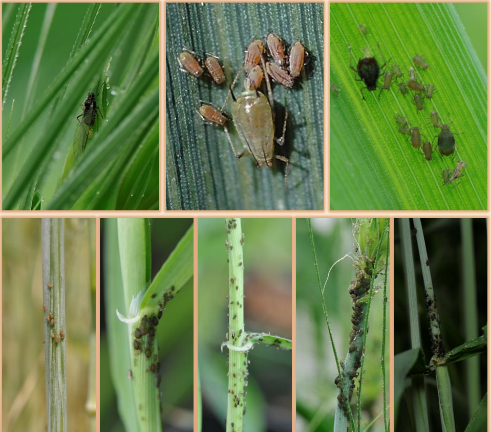
Arriba: adultos (alados y ápteros) y ninfas. Abajo: colonias de pulgón, distintas especies.