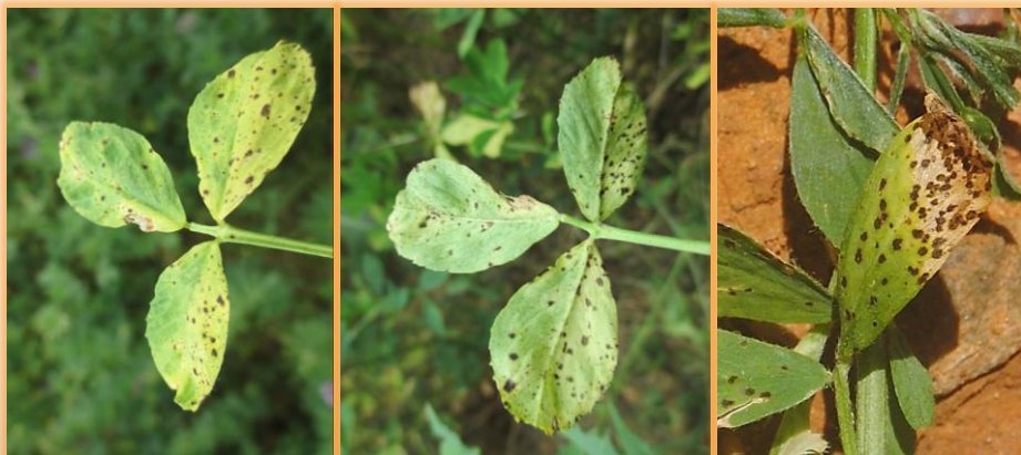
Síntomas en hojas: haz, envés y detalle en foliolo