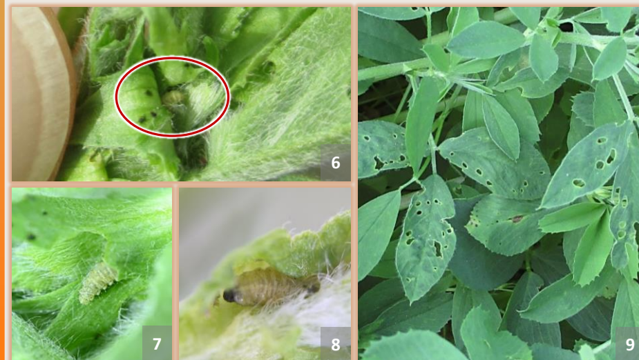
Larvas en el interior de las yemas