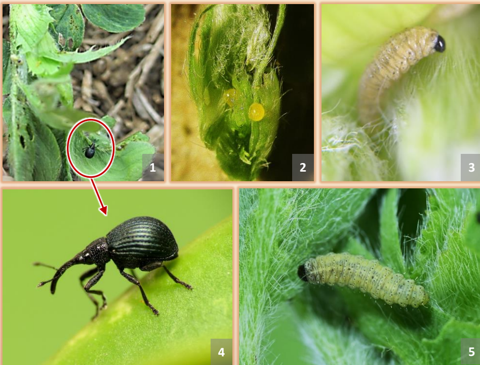
Izquierda: adultos. Derecha: larvas. Medio arriba: huevo