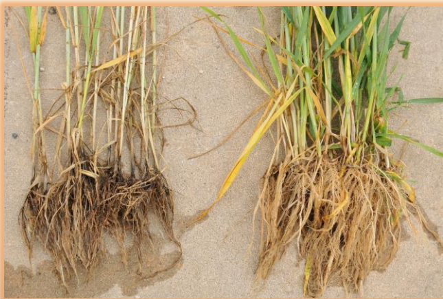
Plantas enfermas frente a sanas