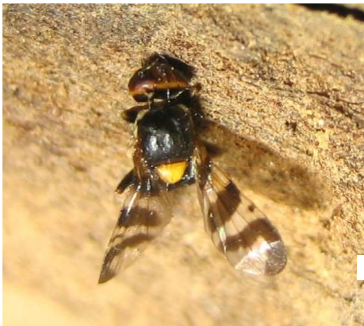
Estación de Avisos Agrícolas del Bierzo

La mosca del cerezo ( Rhagoletis cerasi ) , es un díptero responsable del agusanamiento de las cerezas. Esta pequeña mosca, de aproximadamente medio cm de envergadura, realiza la puesta dentro de la cereza. Las larvas nacidas de estas puestas, blancas, ápodas y de pequeño tamaño, se desarrollan en el interior de la cereza, alimentándose de su carne.