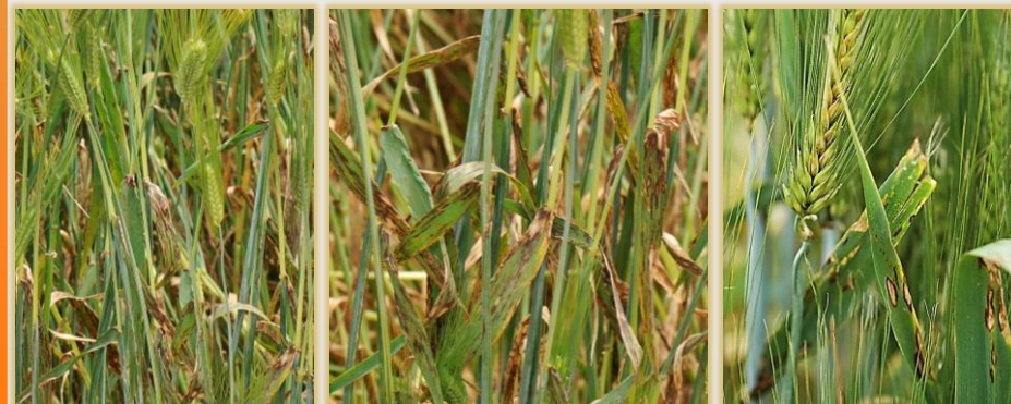
Afectación severa en hojas superiores y espiga