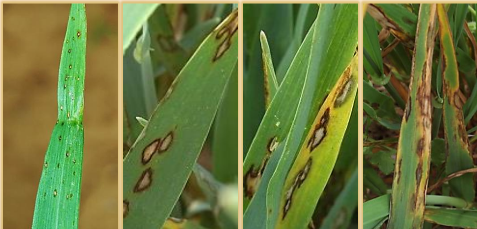
Evolución de la expresión de las manchas en hoja