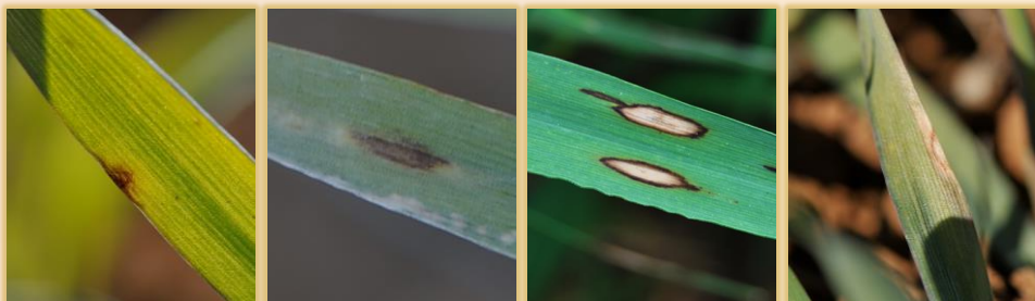
Evolución de las manchas

Muy común en Castilla y León, ocurre con relativa asiduidad. Sin embargo, sólo si se superan los umbrales de tratamiento puede constituir un problema significativo.