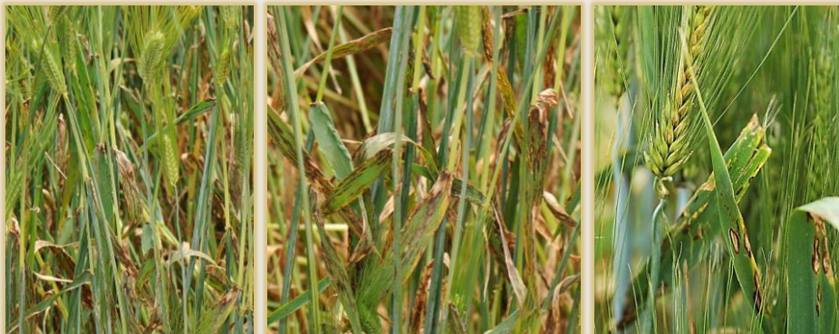
Afectación severa en hojas superiores y espiga