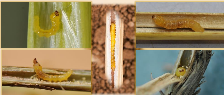
Larvas en tallos seccionados

Cita de esta ficha: García-Ariza, M.C.; Fernández-Villán, M.; Rodríguez-Martínez, A.; Ciudad-Bautista, F.J. y Caminero-Saldaña, C. 2024. Tronchaespigas: calamobius ( Calamobius filum Rossi). En Fichas de apoyo de plagas y enfermedades: Cereales de invierno . Instituto Tecnológico Agrario de Castilla y León (ed). CE-P-06. https://plagas.itacyl.es/cereales