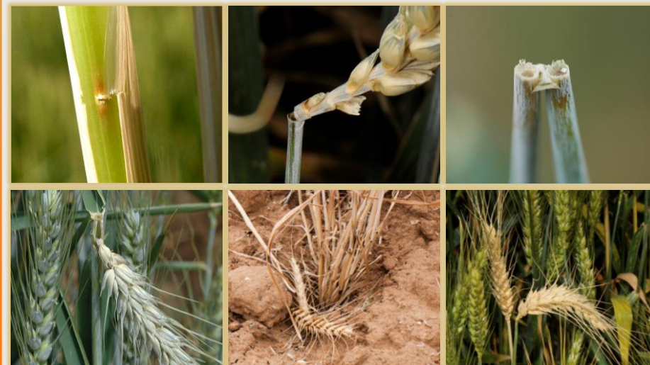
Arriba: incisión de puesta, inicio de tronchadura y sección. Abajo: espiga tronchada, espigas en el suelo y espiga blanca.