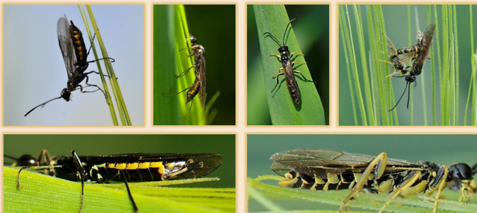
Adultos de Trachelus tabidus