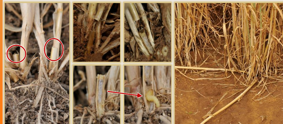
Tronchaduras en la base de la planta, sección de la cámara de pupación y tallos caídos