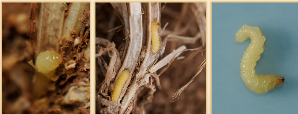
Larvas en tallos seccionados