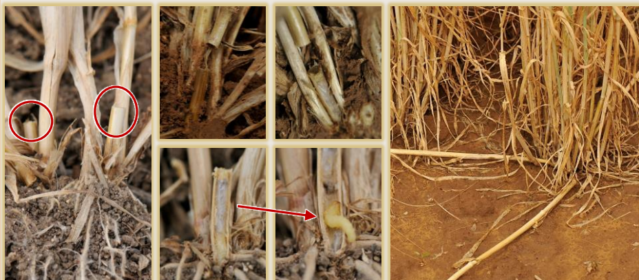
Tronchaduras en la base de la planta, sección de la cámara de pupación y tallos caídos