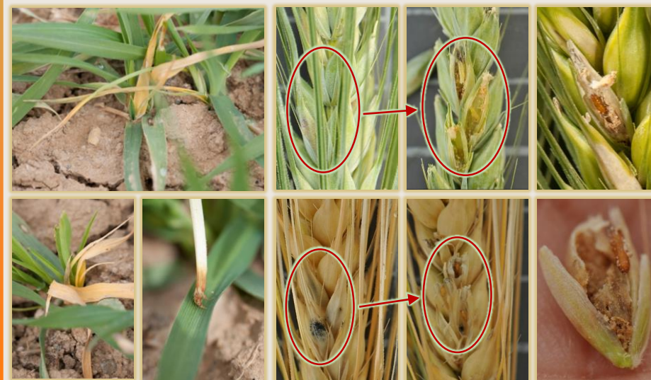
Daño por la 1ª generación