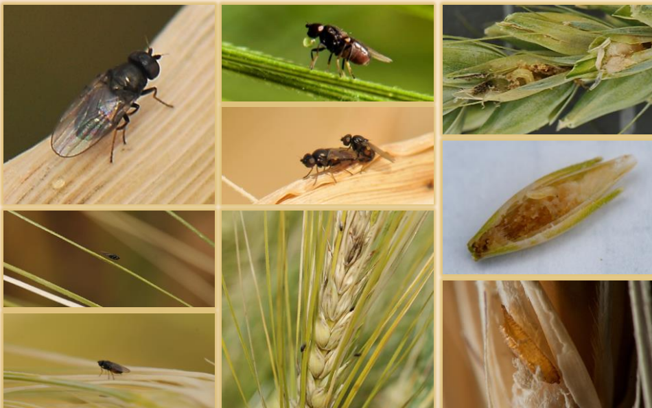
Adultos (moscas muy pequeñas)