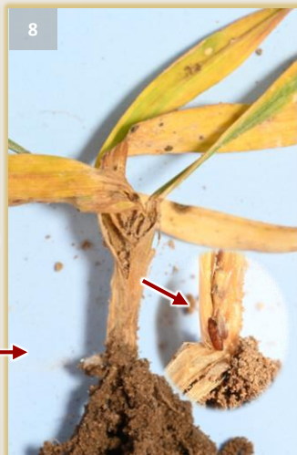
Síntomas en parcela atacada y detalle en planta