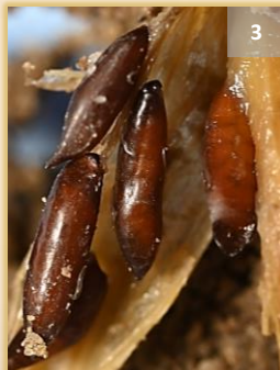
Adulto, larvas (segundo estadio) y pupas