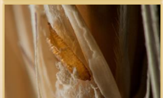
Adultos (moscas muy pequeñas)