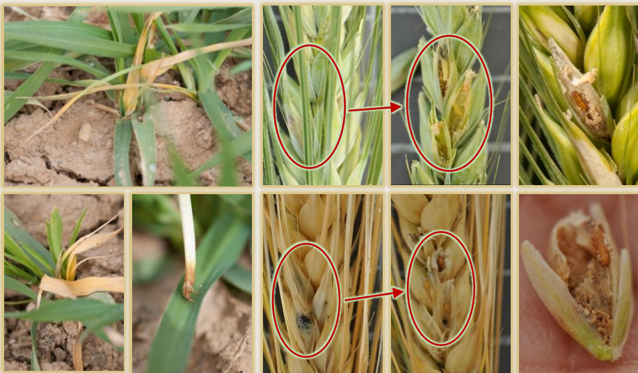
Daño por la 1ª generación