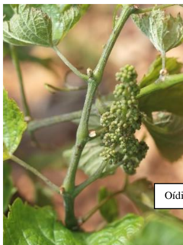
Oídio en pámpano, hojas y racimo.

Las materias activas recomendadas son varias, bien penetrantes o de contacto, (triazoles, estrobilurinas, azufre, ...) y se pueden consultar en la página web el Boletín de Avisos Fitosanitarios de la Rioja nº8 https://www.larioja.org/agricultura/es/publicaciones/boletin-avisos-fitosanitarios-2024