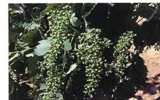
Grano tamaño guisante (Estado K)