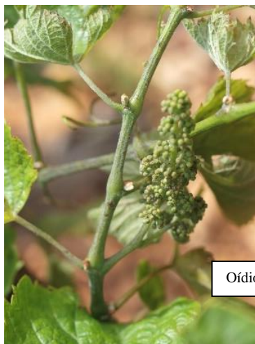
Oídio en pámpano, hojas y racimo.

Las materias activas recomendadas son varias, bien penetrantes o de contacto, (triazoles, estrobilurinas, azufre, ...) y se pueden consultar en la página web el Boletín de Avisos Fitosanitarios de la Rioja nº8 https://www.larioja.org/agricultura/es/publicaciones/boletin-avisos-fitosanitarios-2024