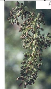
Cuadrado o cuadro de capuchines florales (Estado J)

Nota abreviaturas fenología: At -estado más atrasado, Fr -estado más frecuente, Av -estado más avanzado.