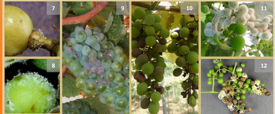
Síntomas en uvas y racimos