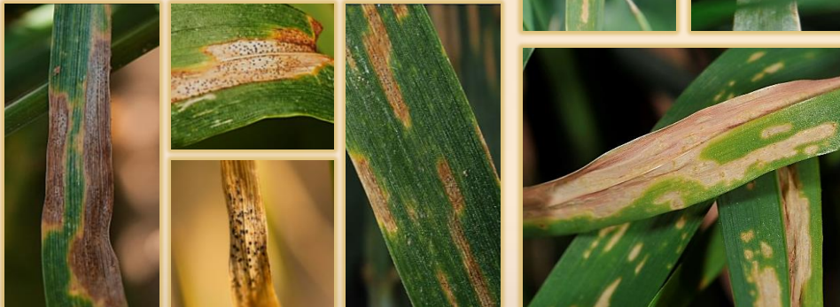
Manchas con picnidios visibles