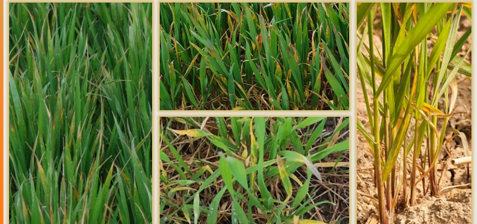
Sintomatología en parcela y plantas