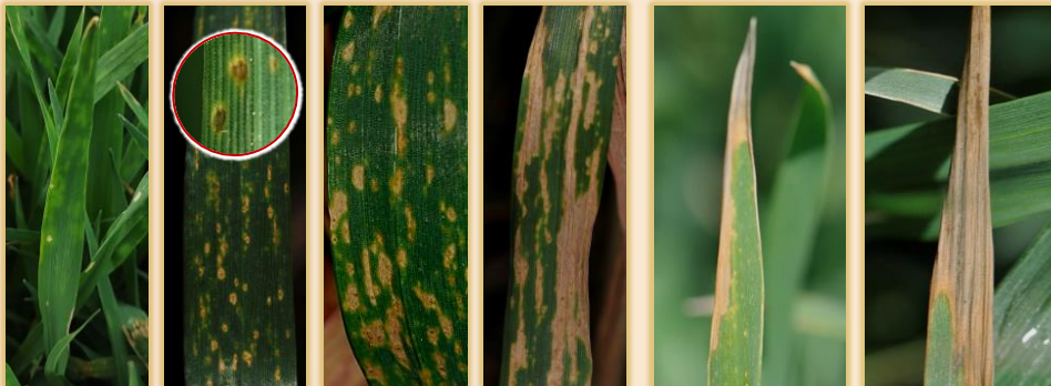
Evolución de las manchas