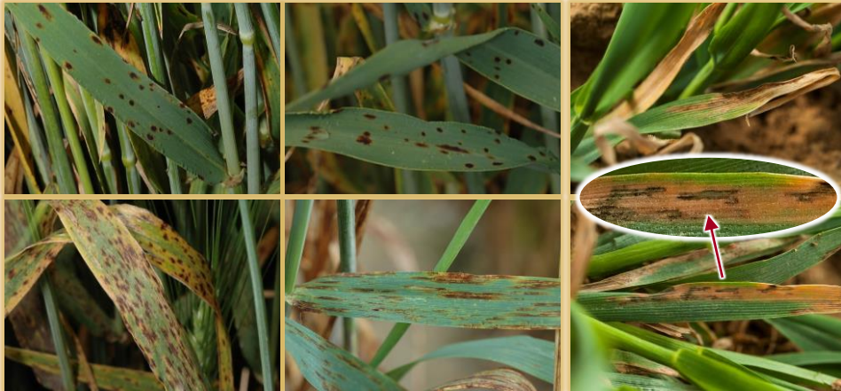
En cebada (arriba: F.sp. maculata ; abajo: F.sp. teres )