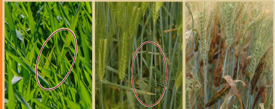
Inicio de infección, primeras manchas en hojas superiores y afectación avanzada severa