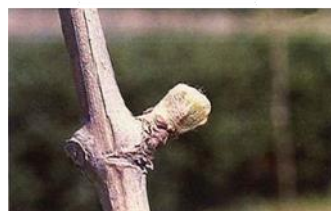
Punta verde (Estado C)