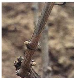
Yema hinchada (Estado B 2 )