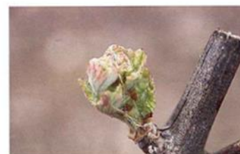
Hojas incipientes (Estado D)