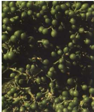
Grano tamaño guisante