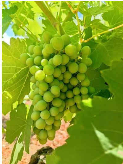
Cierre del racimo (Estado L)