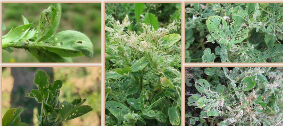
Sintomatología de gusano verde en alfalfa