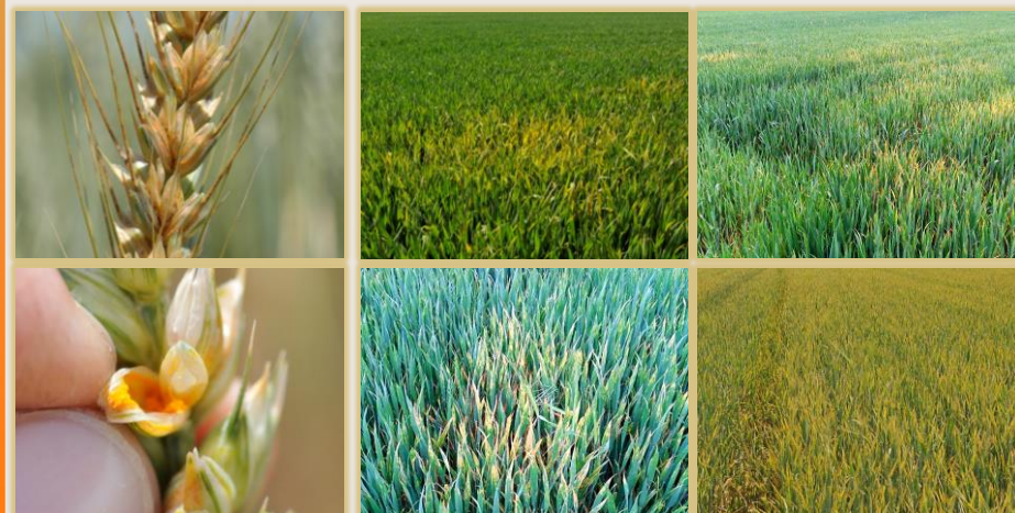
Síntomas en espiga