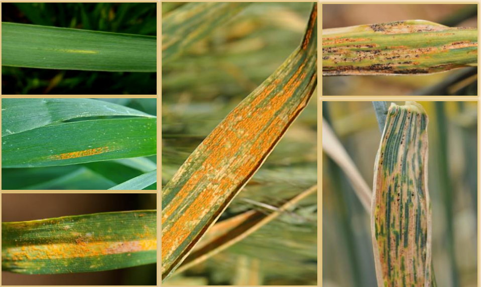
Evolución de la sintomatología en hoja