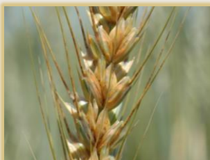
Síntomas en espiga