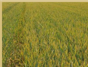
Evolución de la dispersión en parcela