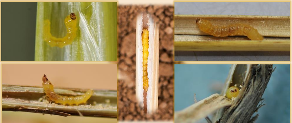
Larvas en tallos seccionados