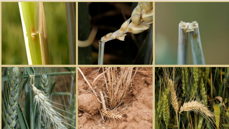
Arriba: incisión de puesta, inicio de tronchadura y sección. Abajo: espiga tronchada, espigas en el suelo y espiga blanca.