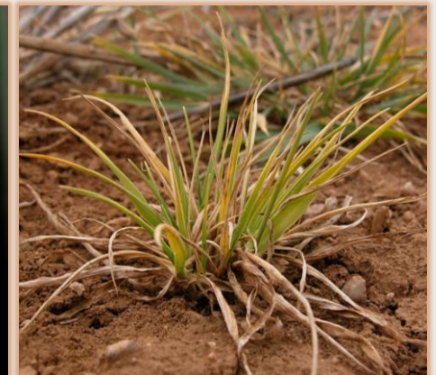
Síntomas de BYDV