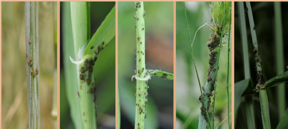
Arriba: adultos (alados y ápteros) y ninfas. Abajo: colonias de pulgón, distintas especies.