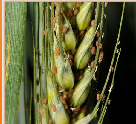
Pulgones en espiga