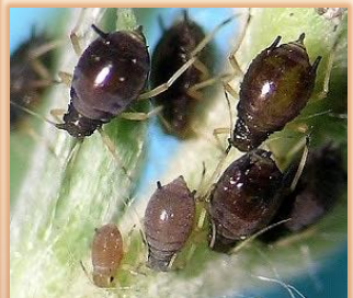
Adultos y ninfas de Acyrtosiphon pisum (verdes) y Aphis craccivora (negros)