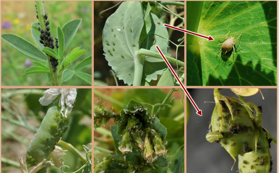
Atacan a todos los órganos aéreos