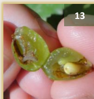
Hilos sedosos: glomérulos