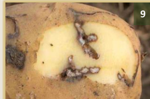
Minadora de hoja