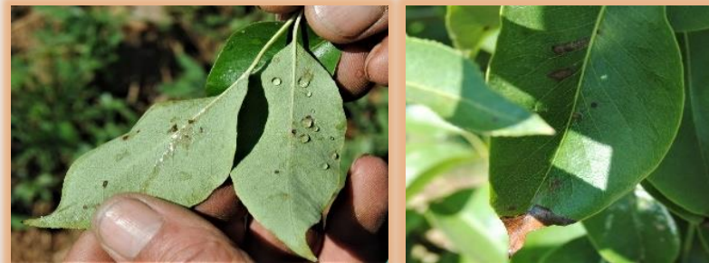
Sintomatología en hojas de peral