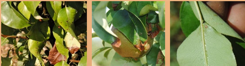
Sintomatología en peral