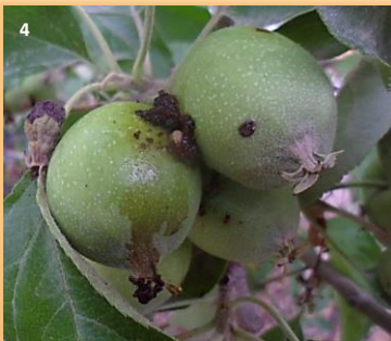
Signos de ataque