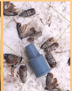
Adultos en trampa