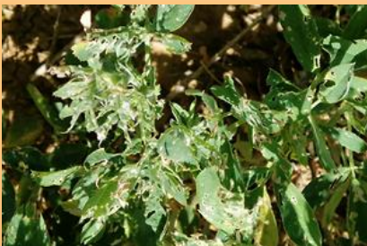
Síntomas en hojas