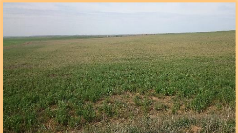
Aspecto de parcela fuertemente atacada